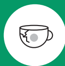
PORCELANA, FAJANS, CERAMIKA